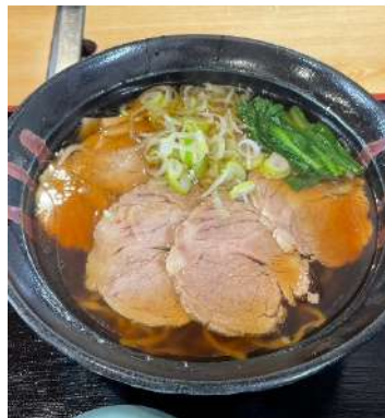
道の駅で食べたラーメン