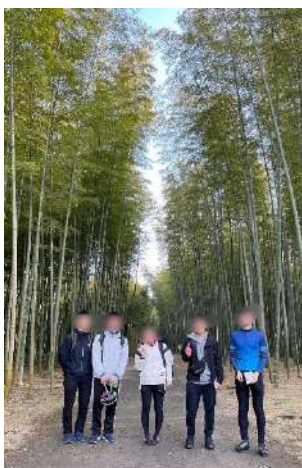
若竹の杜で撮った集合写真

続いて大谷資料館に向かいました。石を切り出した跡が洞窟のようになっていて、人が作ったとは思えない壮大な空間でした。まるでマイクラのよう。閉館ぎりぎりに行ったのでゆっくり中を楽しめなかったのが少し心残りです。