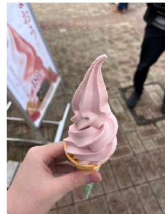
道の駅のあまおうソフトクリーム