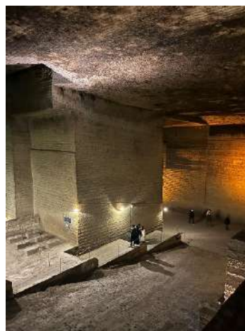
大谷資料館の様子