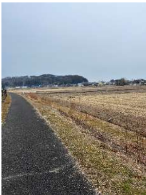
田川のサイクリングロード

道の駅に着くころには雨は弱まりましたがここで問題発生。一人のビンディングシューズがペダルから外れなくなってしまいました。しかし、結構深刻な感じに見えましたがなんとか耐えたみたいです。休日の道の駅ということでそこそこ多くの家族連れで賑わっていました。集合時間も遅かったのでここで早くも昼ご飯を食べ、いちごのソフトクリームも食べ元気になったところで、一度スルーした若竹の杜に向かいました。