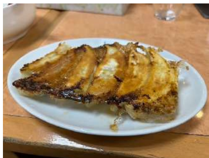
最後に食べた餃子

大谷資料館を見た後は宇都宮駅方面に戻りました。日が暮れかかる時間で少し危険を感じましたが問題なく進みました。最後宇都宮駅前で、近くを走るあらゆる車に暴言を吐く自転車男がいて怖かったです。こちらには絡んでこなかったので安心しました。そんなこんなで無事到着しました。