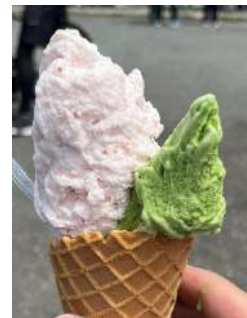
去年の新歓で食べた飯田牧場のアイス

11時過ぎに休憩地点である境川遊水地公園に着きました。ここで、中央林間で置いてきた二人も無事合流。ここで休んだ後飯田牧場に向かいアイスを食べた後休憩、の予定が事業を大幅に縮小してカップに詰められたアイスしか売っていませんでした。去年は牧場の牛から作ったアイスを食べることができたので残念です。