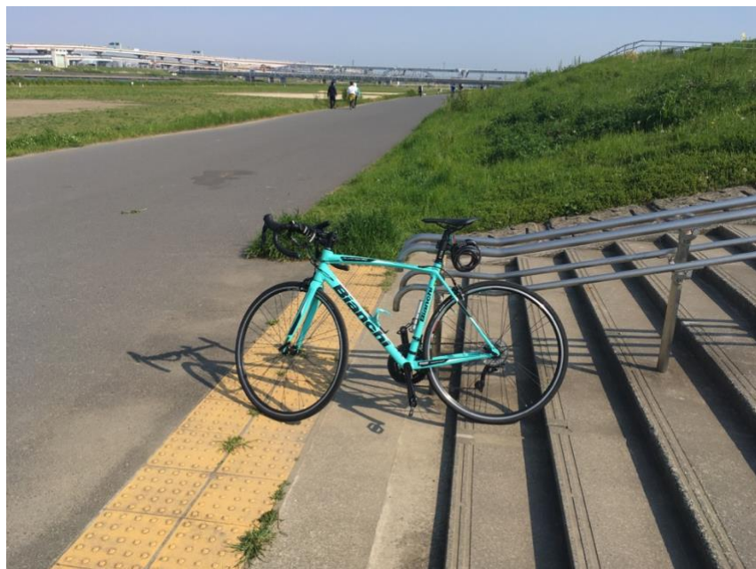
荒川沿いのろーね

このチャリでサイクリングには何回か行きましたが、泊りがけの旅行には行っていません。コロナもあり、しばらくは難しいかなあ。最近だと学校に行くのに使っています。ロードバイクは坂道もスイスイ登れて軽快です！